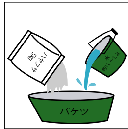
ハヤブサ1袋（5kg）に対して清水約1L～1.2Lを混入して下さい。 その他の混入剤は入れないで下さい。